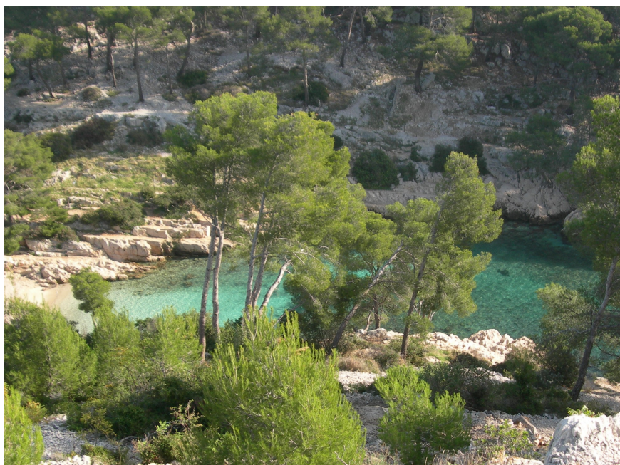
Le début de la Calanque de Port-Pin.

En revenant sur nos pas, nous jetterons au passage un coup d'œil au tout début de la Calanque de Port-Pin (restée intacte elle) avant d'attaquer la montée sur le flanc est de la Calanque d'En Vau (avec une pause à hauteur du Doigt de Dieu qui surplombe le fond de la calanque et d'où l'on peut apercevoir le Belvédère), pour atteindre le Plateau du Cadeiron, rejoindre le GR51 et, de là, redescendre vers le Vallon d'En Vau et la Calanque.