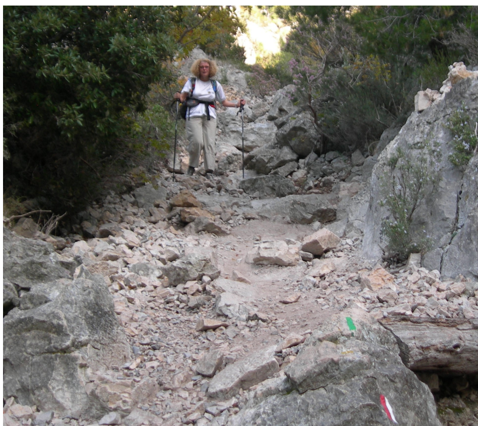
En descendant vers le Vallon d'En Vau par le GR51