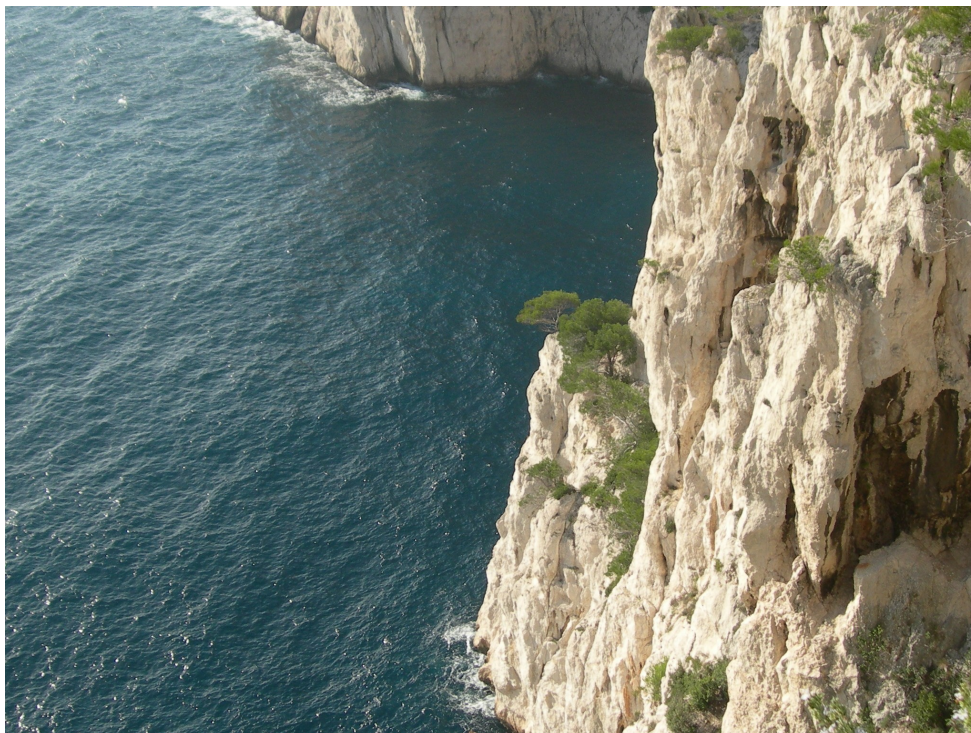
Une hauteur de vue de nature à nous mettre en appétit.

Le retour ne devrait pas poser de problème.