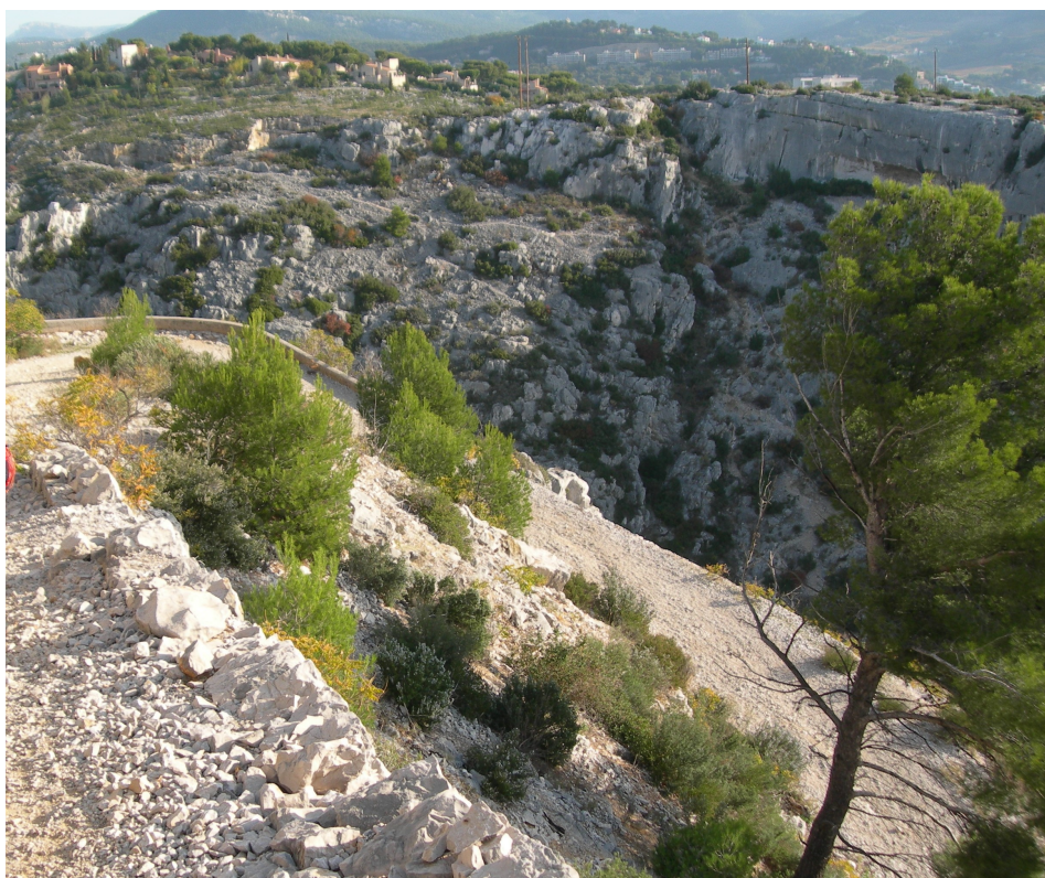
En descendant vers la Calanque de Port-Miou.