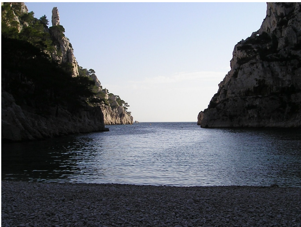
Le fond de la Calanque d'En Vau..

Après quelques courts instants de répit, nous retournerons sur nos pas en direction du Portail d'En Vau, puis à gauche vers le Col de l'Oule, enfin, toujours à gauche, vers le Belvédère d'En Vau où nous déjeunerons, à l'aplomb de la falaise.