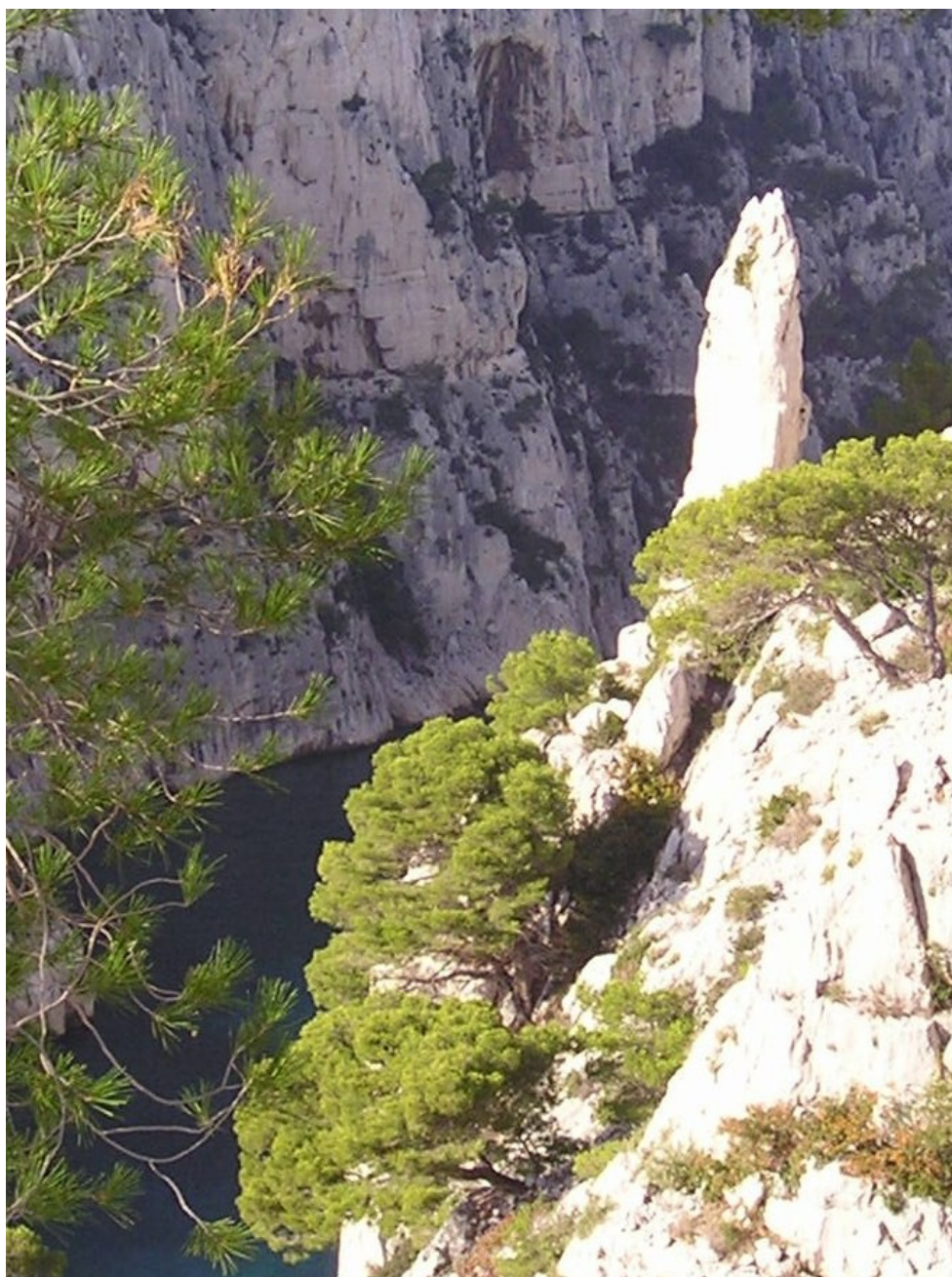
Le Doigt de Dieu.