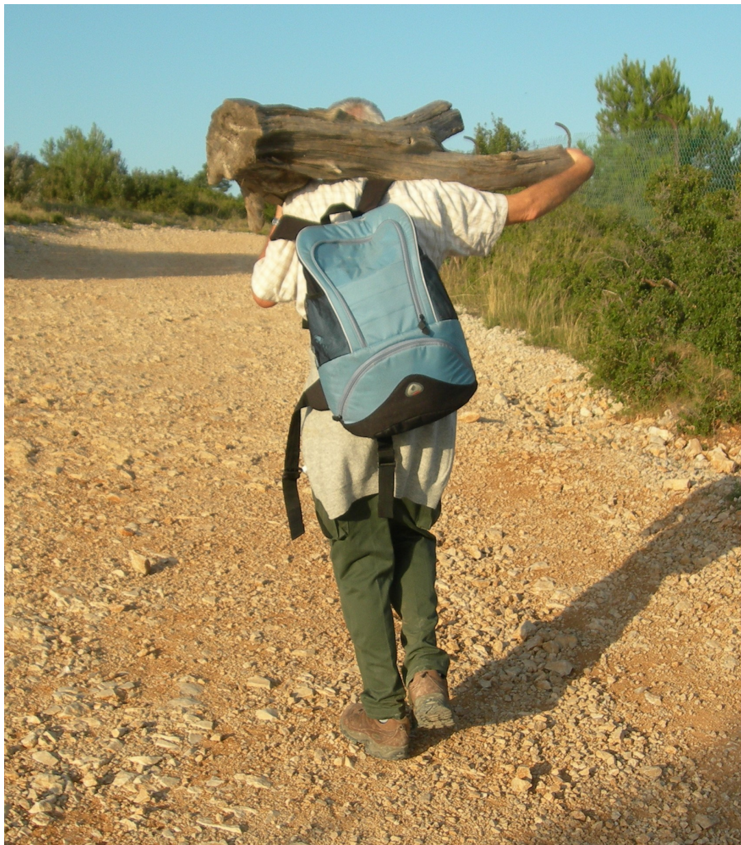
Un handicap, pour ajouter encore à la difficulté!

Ça vous a plu. Alors à dimanche prochain