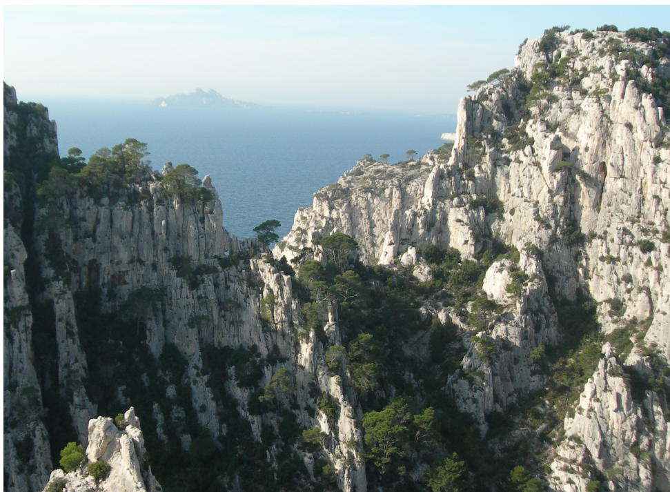
En haut, à droite, le Belvédère d'En Vau..