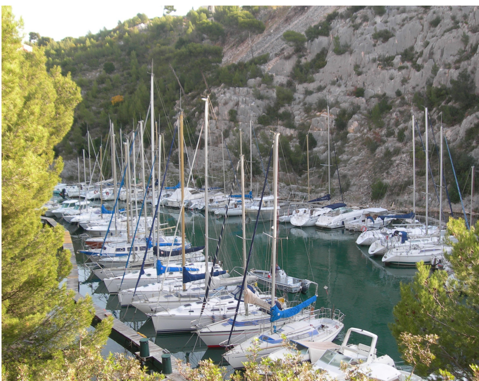
La Calanque de Port-Miou: à n'en plus douter, désormais, elle mérite bien son nom de port!