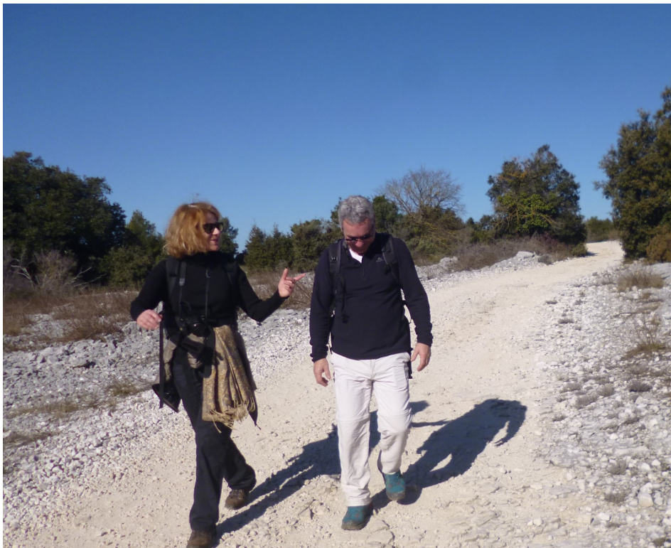
« Dans une poêle, tu fais revenir quelques échalotes, tu rajoutes quelques lardons et.....tu as gagné la guerre! »

Cap unité-huit-zéro comme disent les aviateurs pour environ 3,5 km jusqu'au point A (voir la carte en fin de présentation). Sur cette piste, très agréable, qui descend sur Le Revest, les Tirailleurs Sénégalais étaient loin d'imaginer qu'ils pourraient gagner la guerre comme le laissent entendre nos deux protagonistes (Sic Alain).