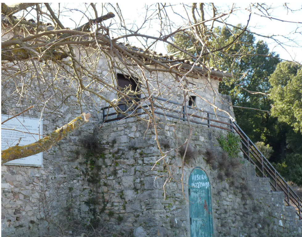
La Bergerie : certains d'entre nous l'ont bien connue quand ils étaient jeunes scouts ou éclaireurs de France, le bon temps quoi !

-la Bergerie de Siou Blanc, objectif final de cette randonnée avant le retour aux voitures.