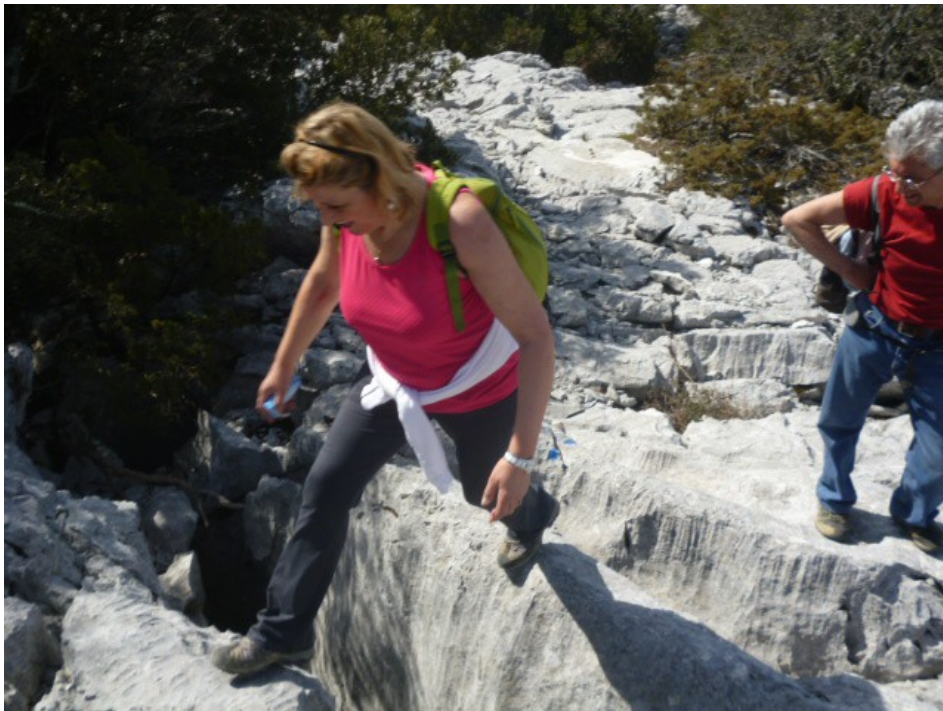
Franchissement d'une crevasse (La photo date de 2014).

Du point A jusqu'en B (Pyramide de Cassini), ce sera une lente progression sur des roches de calcaire, entrecoupée de crevasses qu'il faudra enjamber.