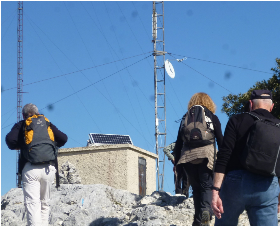
L'arrivée aux antennes.

Enfin, les antennes, et le point culminant (784 m, matérialisé par la pyramide de Cassini, savant-géomètre mandaté par Louis XV pour établir une cartographie du royaume) d'où l'on peut embrasser un vaste panorama: l'imposant Mont Caume, les Iles d'Hyères et le Coudon,