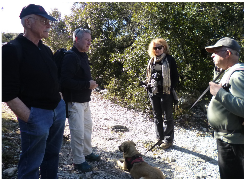
Quelques instants de réflexion avant d'entamer la deuxième partie du circuit.

Après le repas, en B, nouveau point de situation pour déterminer s'il y a lieu de se rendre directement aux voitures.