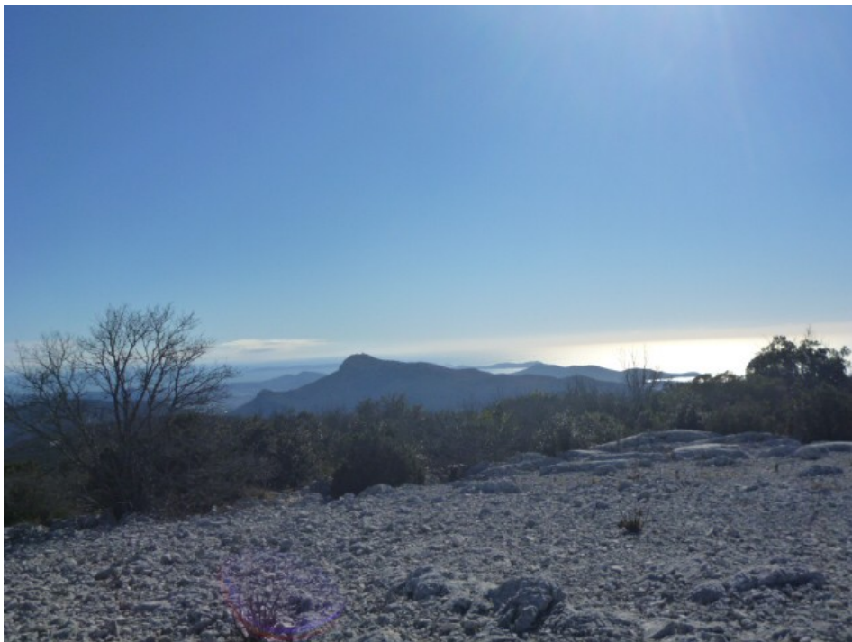
Les Iles d'Hyères.