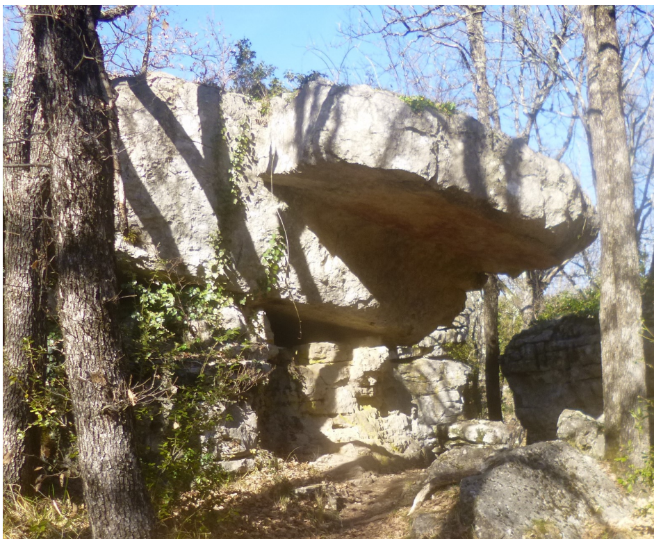
Le dolmen en question.

-un imposant dolmen. Pour l'avoir examiné de près, on peut vous affirmer que le rocher du dessus repose simplement sur le socle du dessous et qu'ils ne sont en aucun cas solidaires,