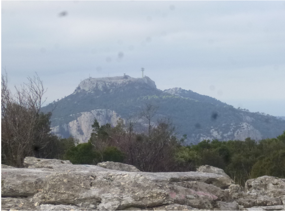
Le Mont Caume.