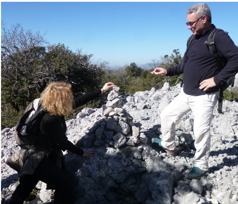
L'essentiel c'est de les conserver en bon état en apportant chacun sa pierre à l'édifice, aussi petite soit-elle !

Comme toujours, en pareil cas, le balisage fait souvent défaut, heureusement qu'il existe quelques points de repères (cairn) comme celui-ci.