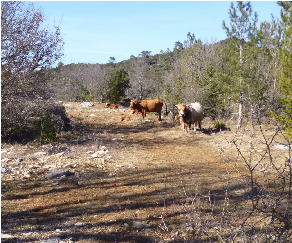
Troupeau de vaches en sous-bois. Attention leur calme apparent pourrait s'avérer dangereux.

- un paisible sous-bois abritant le repos de quelque ruminants somnolents,