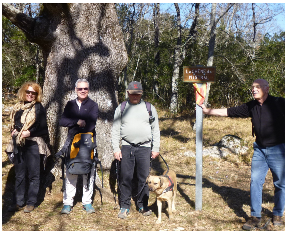
Le Chêne de Mistral.