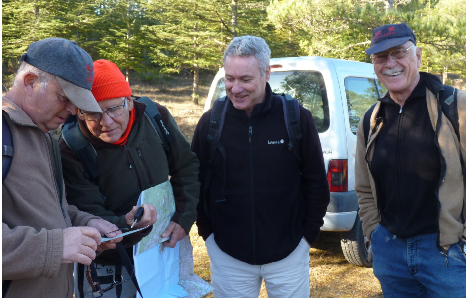
Le navigateur est sommé de s'expliquer.

Avant de partir à l'aventure, il est bon de s'entourer de certaines garanties : le navigateur connaît-il son affaire ? Où va-t-on, dans quelle direction, quelles seront les difficultés et, surtout, aura-t-on l'assurance de retrouver les voitures ?