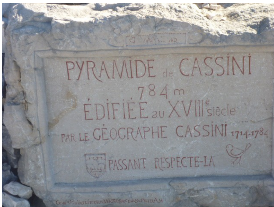
Stèle apposée au pied de la Pyramide de Cassini.