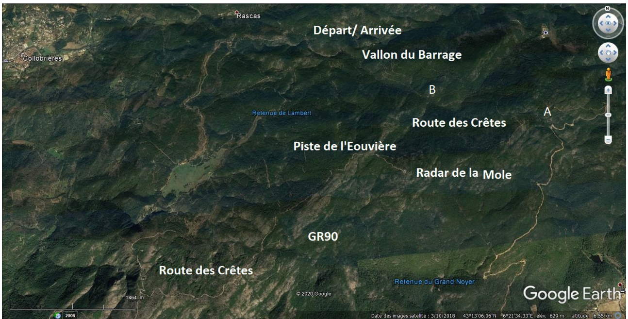
Vue d'ensemble du circuit en 3D.