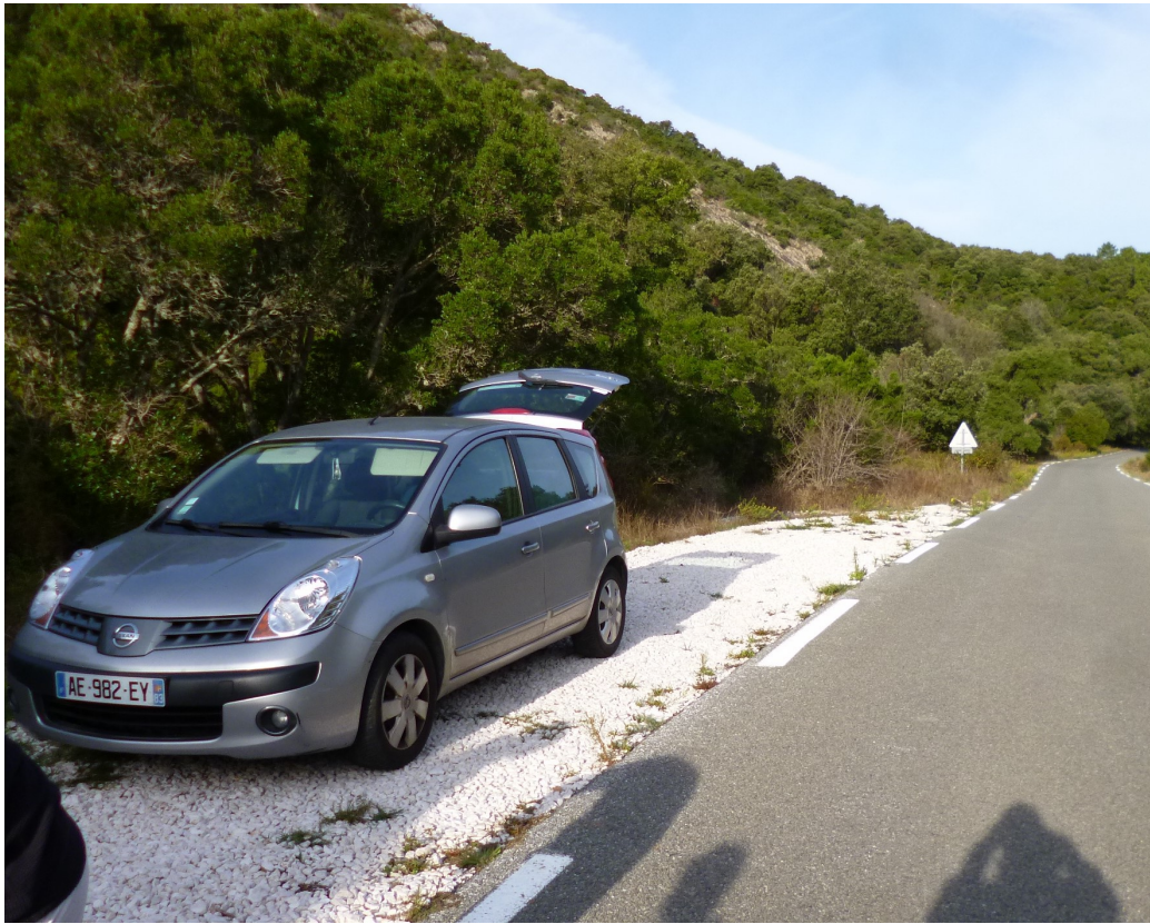
Parking au départ, c'est véritablement étroit !