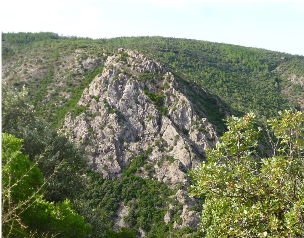
Un vallon surplombé de rochers caractéristiques.

Reprenons notre périple sur cette Route au revêtement goudronné à moitié défoncé qui, compte tenu de l'état d'esprit de l'équipe par moment, s'apparentait d'avantage à une traversée du désert, monotone, sans point de repère caractéristique, alors qu'en réalité, il suffisait de plonger son regard pour découvrir de profonds vallons aux flancs recouverts de magnifiques rochers ou de le lever pour embrasser un vaste panorama qui s'étend depuis la mer jusqu'à la Sainte-Victoire.