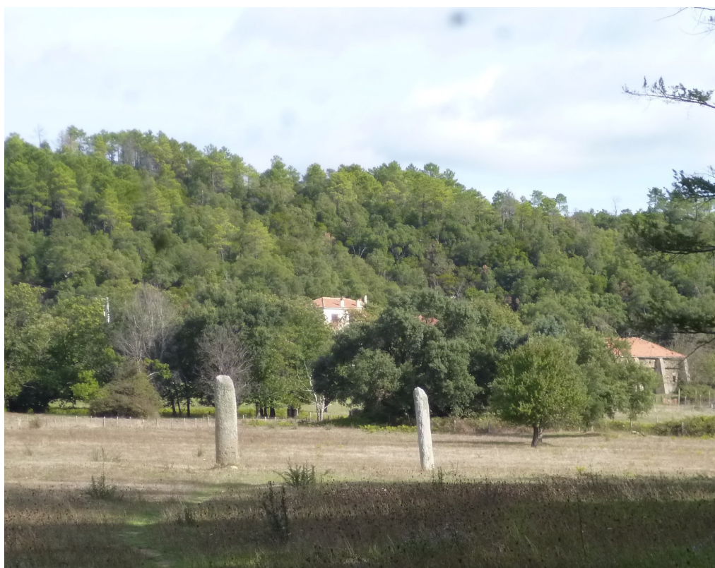
Les deux menhirs à l'entrée des propriétés.