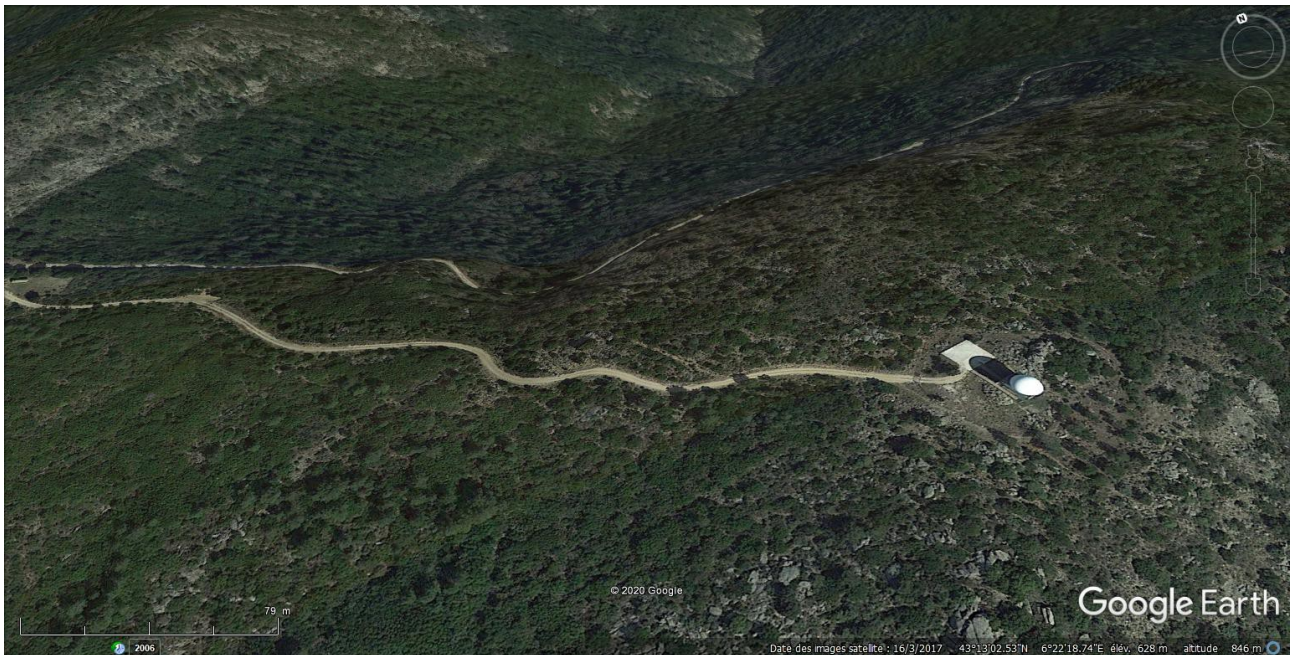
Une vue en 3D du radar météorologique de La Mole.

Poursuivons notre progression, au moins jusqu'au radar météorologique de La Mole. Parvenus à cet endroit nous prendrons la décision soit de retourner sur nos pas en direction de l'embranchement avec la piste d'Eouvière soit de la prolonger jusqu' au départ du vallon du Barrage.