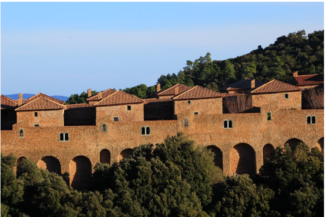
Les remparts de l'abbaye de La Verne dignes d'un décor du roman «au nom de la rose».

Attardons-nous un instant pour les contempler. La littérature s'accorde à dire que ces monuments ne sont pas l'œuvre d'un architecte épris de l'époque néolithique mais qu'ils datent bien de plusieurs dizaines de milliers d'années. Ils sont d'ailleurs classés au titre des monuments historiques. Pour l'anecdote, une légende laisse entendre qu'ils étaient destinés à indiquer l'entrée d'un souterrain, creusé par les moines, pour accéder à l'Abbaye. Bizarre tout de même d'attirer ainsi le regard vers un emplacement qui devait être tenu secret! Mais bah, l'imaginaire collectif n'est pas à une contradiction près tant il est prompt à s'enflammer à l'évocation de la vie secrète et monacale de ces bons pères , reclus entre les hauts murs d'enceinte de l'abbaye.