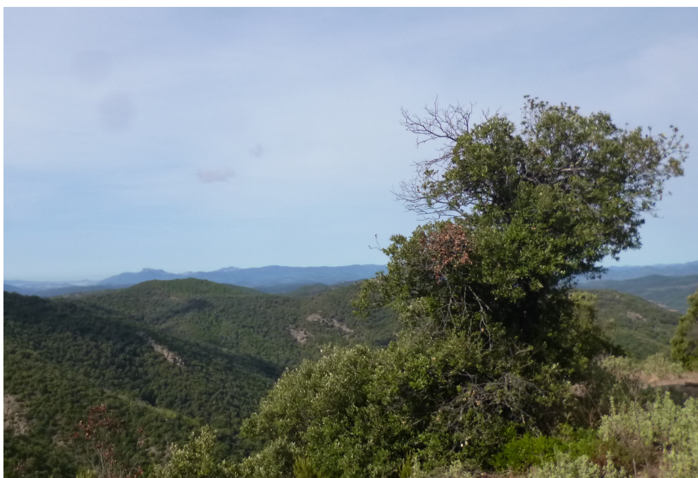
Une petite fenêtre ouverte dans un vaste panorama.