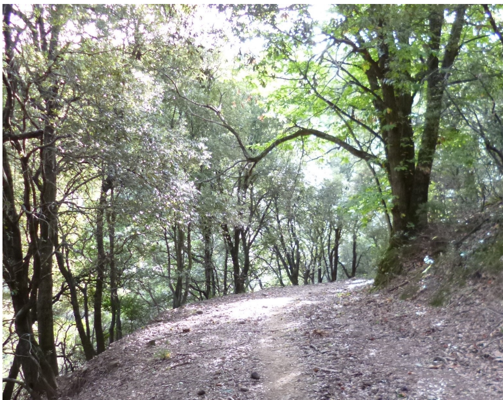
La piste en sous-bois.

Jusqu'au Plateau Lambert, la piste se déroule en sous-bois sur une pente douce. A l'entrée du Plateau se dresse une solide cabane aménagée en salle-à-manger qui rappelle celles que nous avons rencontrées sur la route du Camp Bourjas et au Broussan.