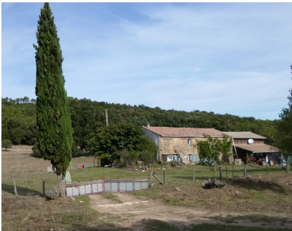
Une des deux propriétés sises sur le Plateau.

Nous contournerons le Plateau par la gauche pour nous engager sur la Route des Crêtes non sans avoir, auparavant, jeté un coup d'œil sur ces désormais célèbres menhirs familiers à tous les randonneurs.