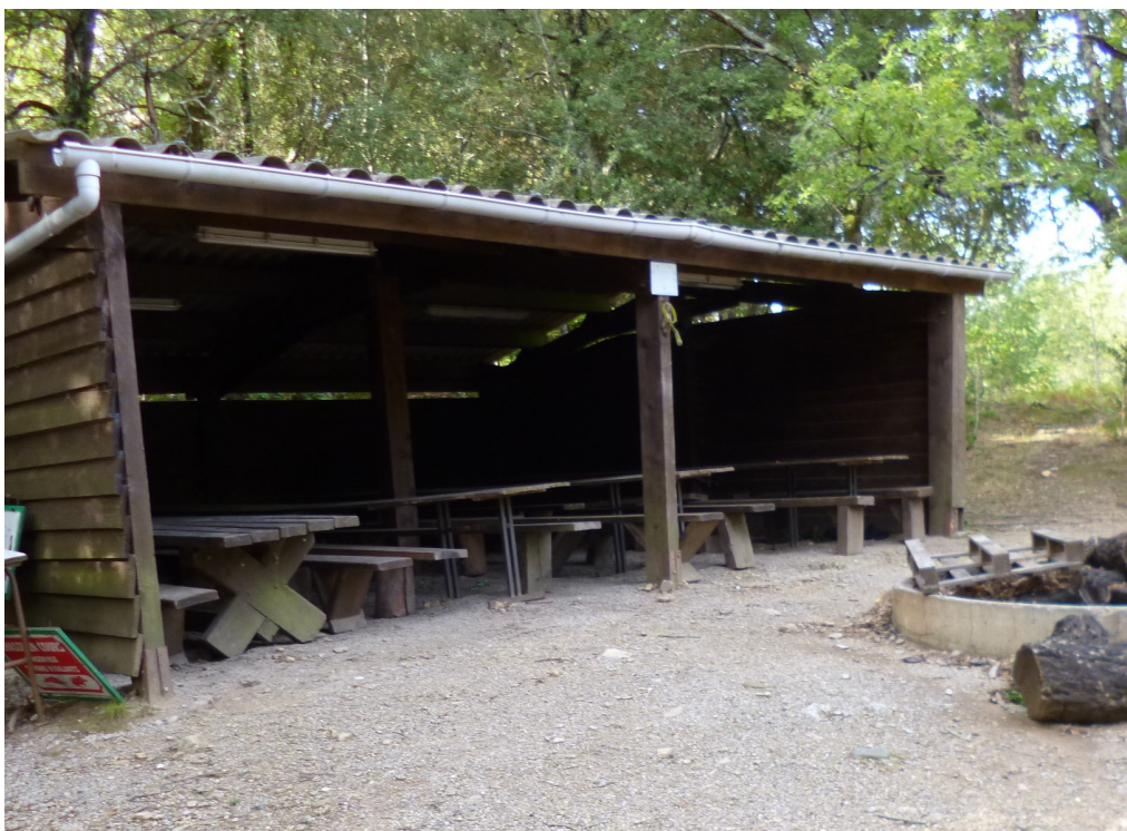
Plus qu'un abri, un véritable restaurant!