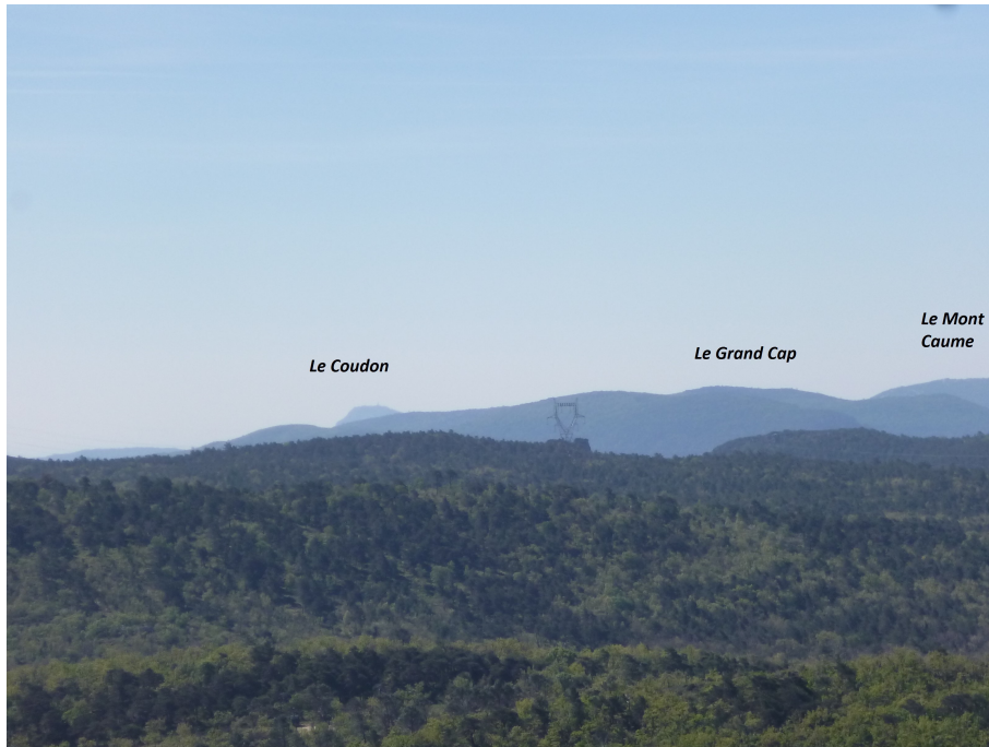
Le Coudon, le Grand Cap, Le Mont Caume.

Reportez vous maintenant en fin de présentation pour découvrir, sur la carte, l'itinéraire détaillé et pour vous faire une idée, bien que l'image en 3D soit relativement aplatée, du relief que vous allez rencontrer.