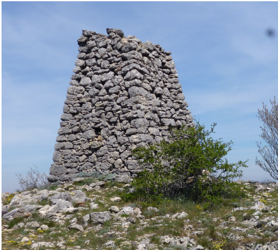
La pyramide de Cassini

Passé l'aplomb du cirque, 1km après, on rencontrera une pente courte mais très raide puis l'ascension reprendra doucement jusqu'au point culminant de 919 m matérialisé par une pyramide, pyramide de Cassini , rappelez vous ce géologue du 18ème siècle qui en a érigé une au Grand Cap .