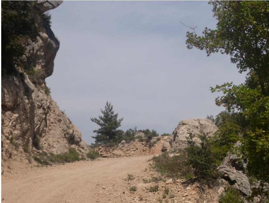
La piste à la fin de la remontée en sortie du Vallon du Thuya

Précisons qu'il sera toujours possible de nous séparer en deux groupes, le premier empruntant la route des crêtes, le second, la piste apparemment moins difficile, pour se rejoindre au pied de la Pyramide. Nous aviserons sur place.