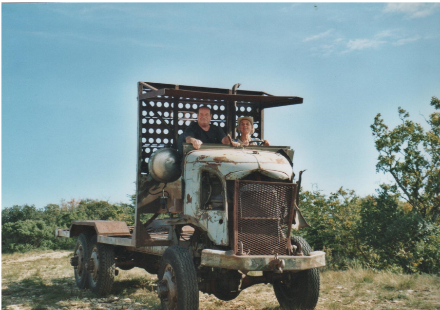
Le camion en question.

Un dernier point. Guy, qu'as tu-fait de ton camion? Il a disparu.