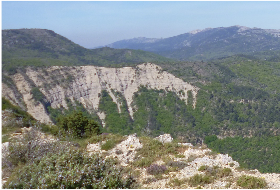
Le cirque des Escarettes

Passé l'aplomb du cirque, 1km après, on rencontrera une pente courte mais très raide puis l'ascension reprendra doucement jusqu'au point culminant de 919 m matérialisé par une pyramide, pyramide de Cassini , rappelez vous ce géologue du 18ème siècle qui en a érigé une au Grand Cap .