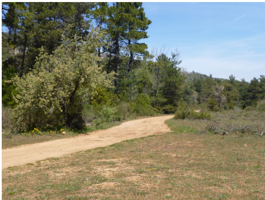
La piste en terrain plat.