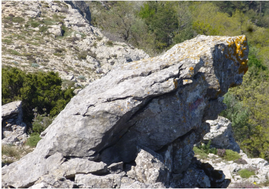
Bizarrie éolienne. Un ours ?