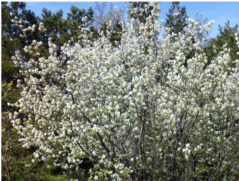
Une végétation épanouie.