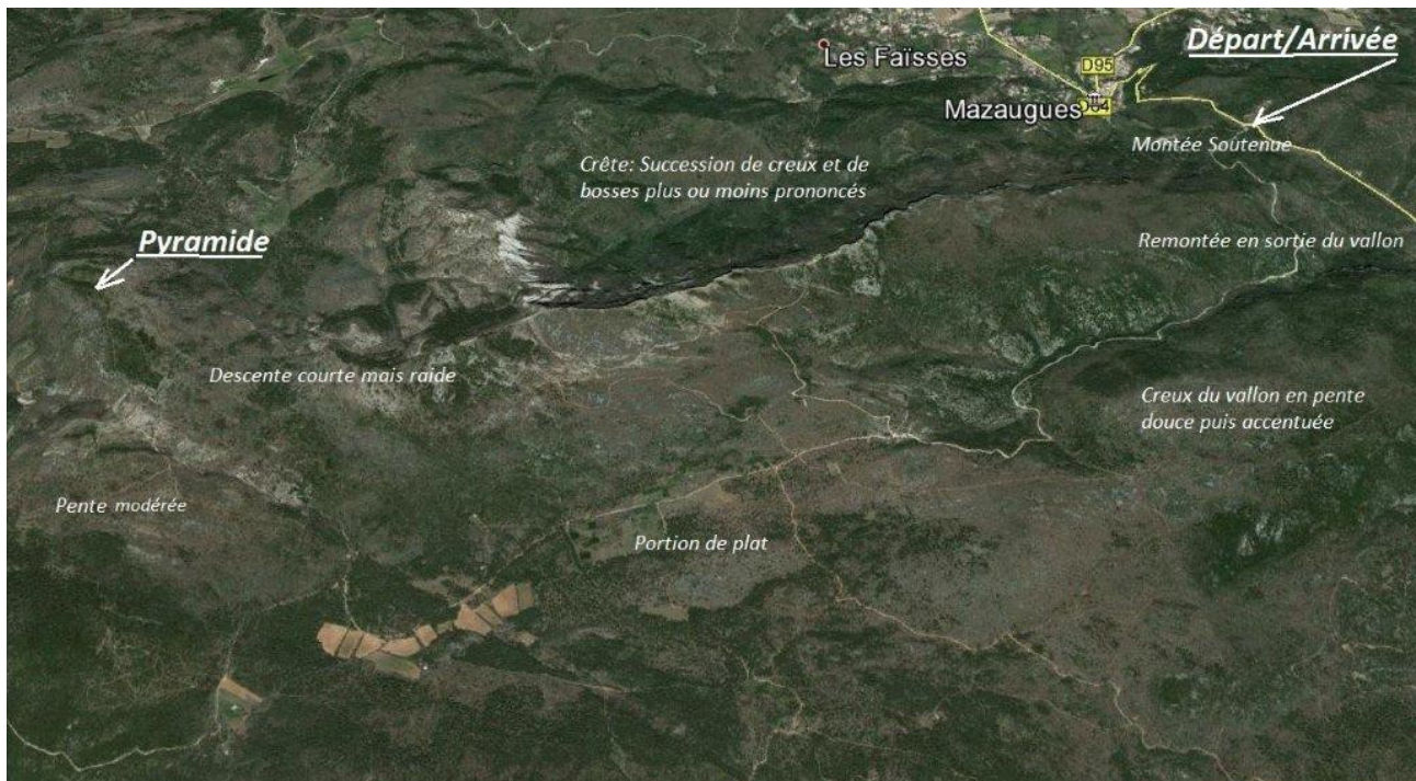
La randonnée en 3D