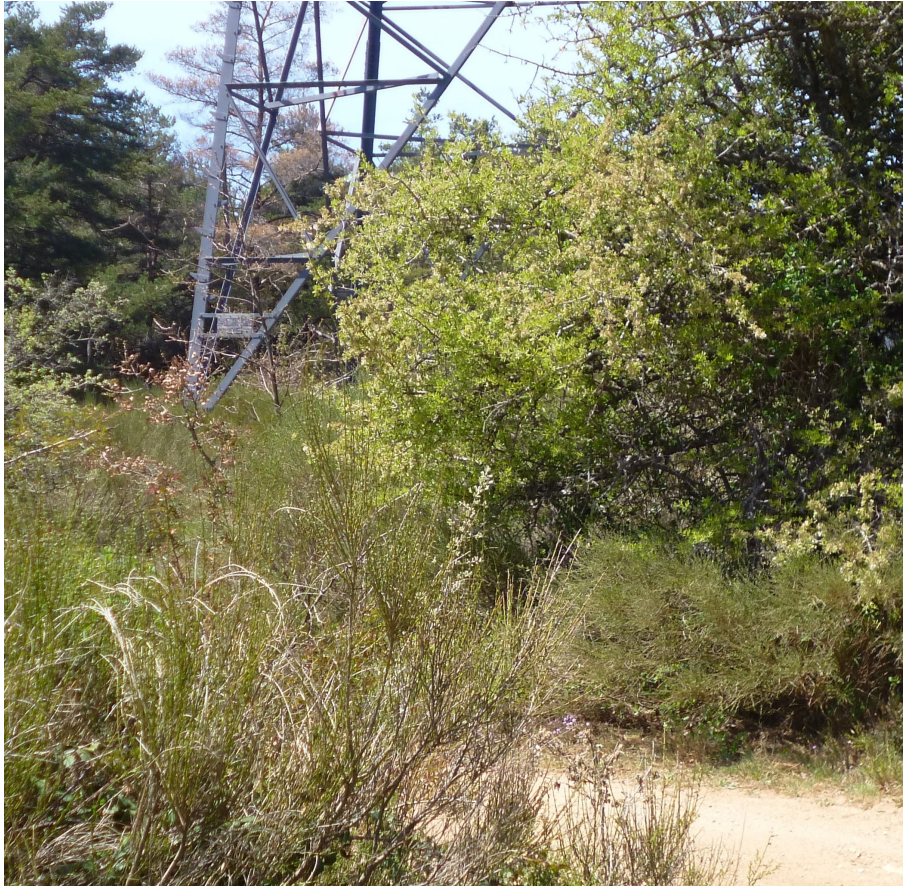
Croisement de la ligne à haute tension et de la piste.

Nous pourrons déjeuner pas très loin de la Pyramide. A l'issue du repas, il nous restera un bon bout de chemin à parcourir mais sur une portion d'itinéraire qui ne présente pas de difficultés particulières, d'abord sous une ligne à haute tension, puis sur une large piste découverte (prendre garde au soleil!) qui se déroule longtemps en terrain plat, pour plonger ensuite au creux du Vallon du Thuya , remonter et redescendre jusqu'au Col de Caucadis , point de départ de la randonnée.