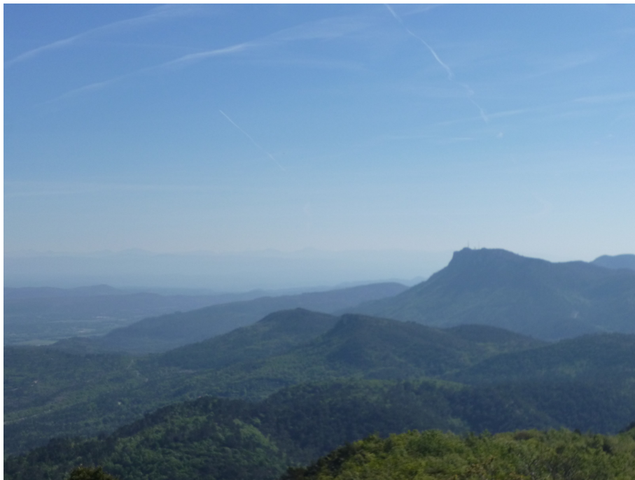
La Montagne de La Loube.

Elle laissera des traces, de fatigue certes, mais aussi de bonheur: satisfaction d'avoir accompli un bel effort. Découverte d'un panorama exceptionnel avec la montagne de la Loube au nord-est, les Gorges du Caramy et la Chapelle Saint Pancrace au nord, la Sainte- Baume , la Sainte Victoire au nord -ouest, le Coudon , le Grand Cap , le Mont Caume au sud et, tout au fond, au sud-est, les Îles d'Hyères , autant de lieux qui nous sont désormais familiers et de sommets que nous avons gravis parfois durement. En prime, c'est donc la concrétisation de notre bilan de randonneurs qu'il nous est offert de contempler, bilan dont nous pouvons être fiers (Désolés, les photos sont de médiocre qualité, le ciel était voilé le jour de la reconnaissance).