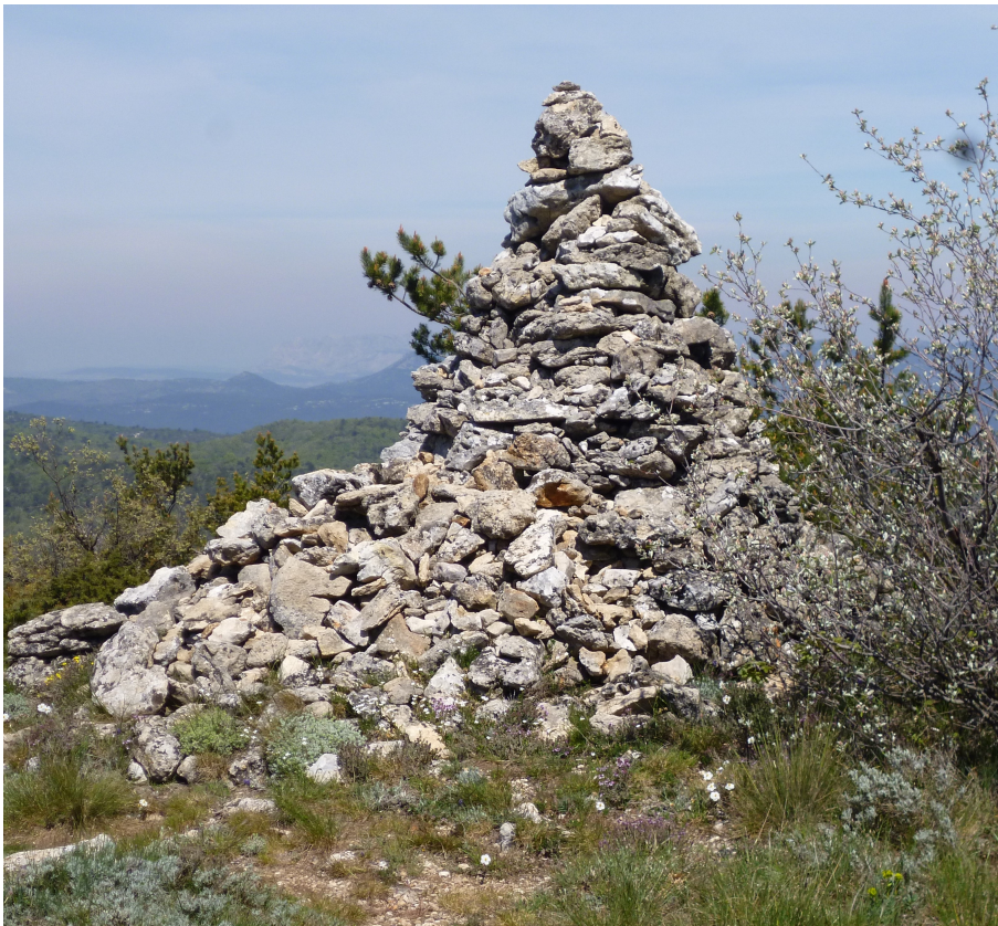
Un cairn qui restera visible même sous la neige !