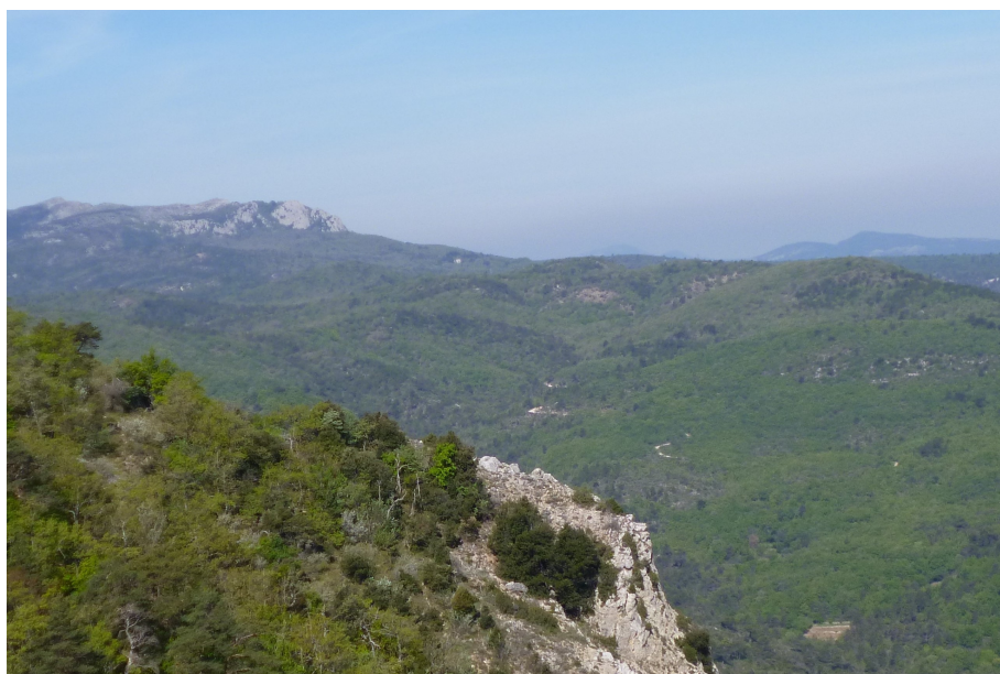
La Sainte- Baume et La Sainte Victoire..