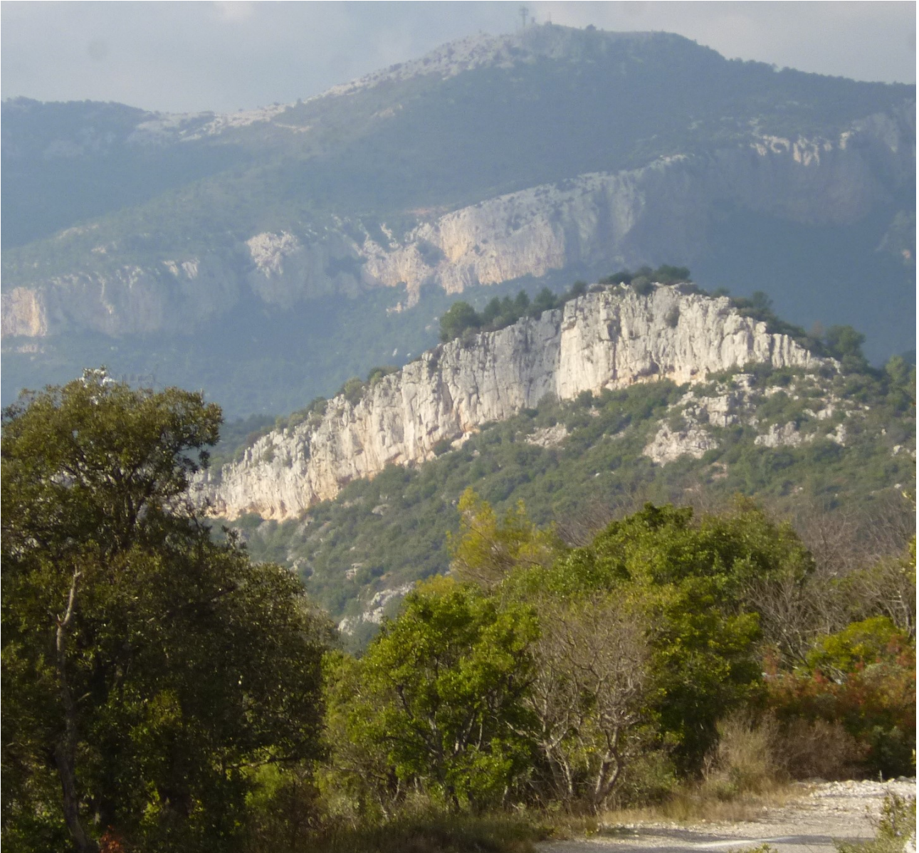
Sur le chemin du retour. Au fond, le Mont Caume, au premier plan la vieille Valette.