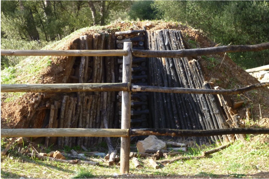
Une charbonnière, on s'éloigne un peu des olives mais bah !