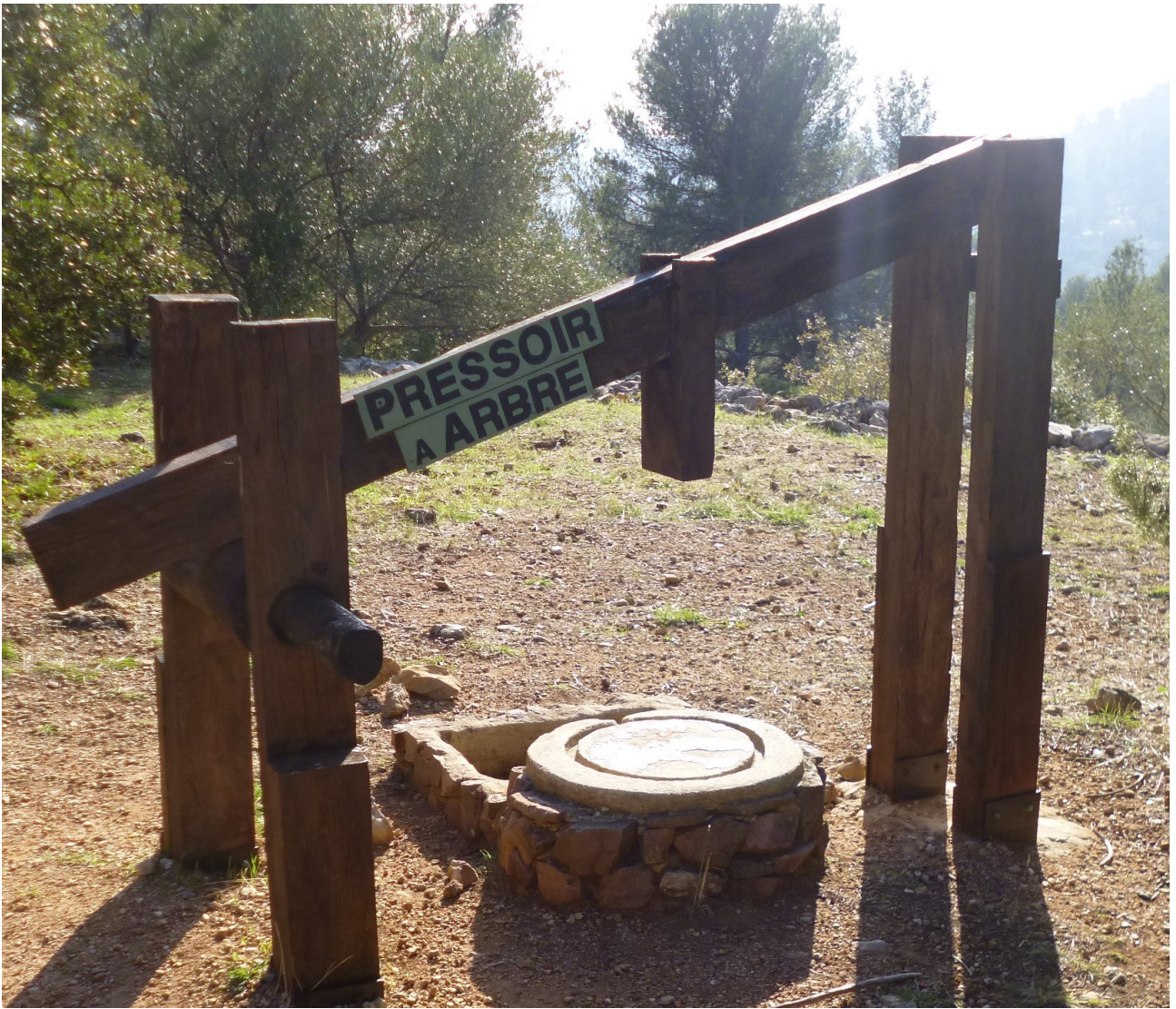
Un pressoir à arbre mais encore?

Le prix du Gabelou érudit sera décerné à celle ou à celui qui trouvera l'emploi de cet appareillage ainsi que la signification exacte de son appellation ou qui en donnera une explication la plus vraisemblable.