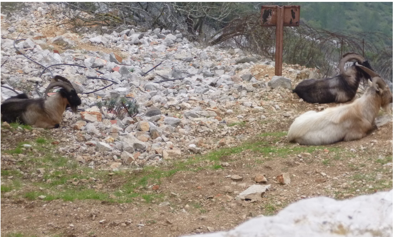
Aux pieds du Fort, quelques rencontres insolites comme ces mouflons qui ne semblent pas être gênés outre-mesure par les rayonnements électromagnétiques.