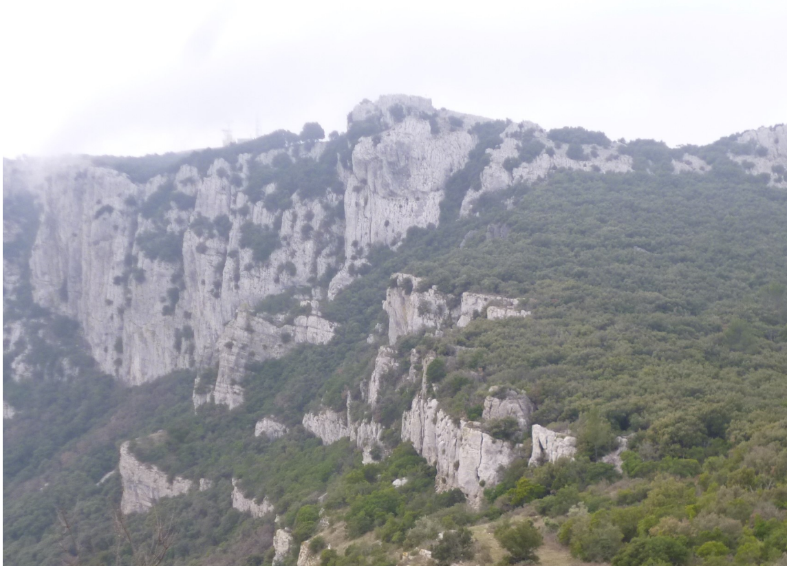
Le versant nord du Coudon. Au premier plan, le petit Coudon et les barres sur lesquelles passe le GR51, quelques fois très près du bord!