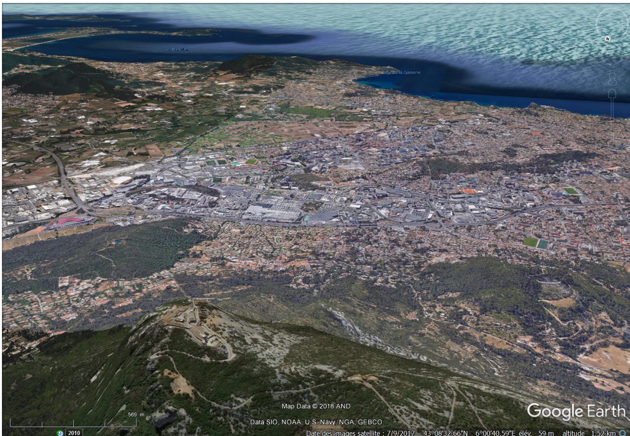
Vue du haut du Coudon en 3D.

Le sommet du Coudon (700m tout de même) en est le point d'orgue mais quel panorama vu d'en haut et quel plaisir de pouvoir déjeuner avec les îles d'Hyères, les villes de Toulon et de La Valette largement étendues à ses pieds!