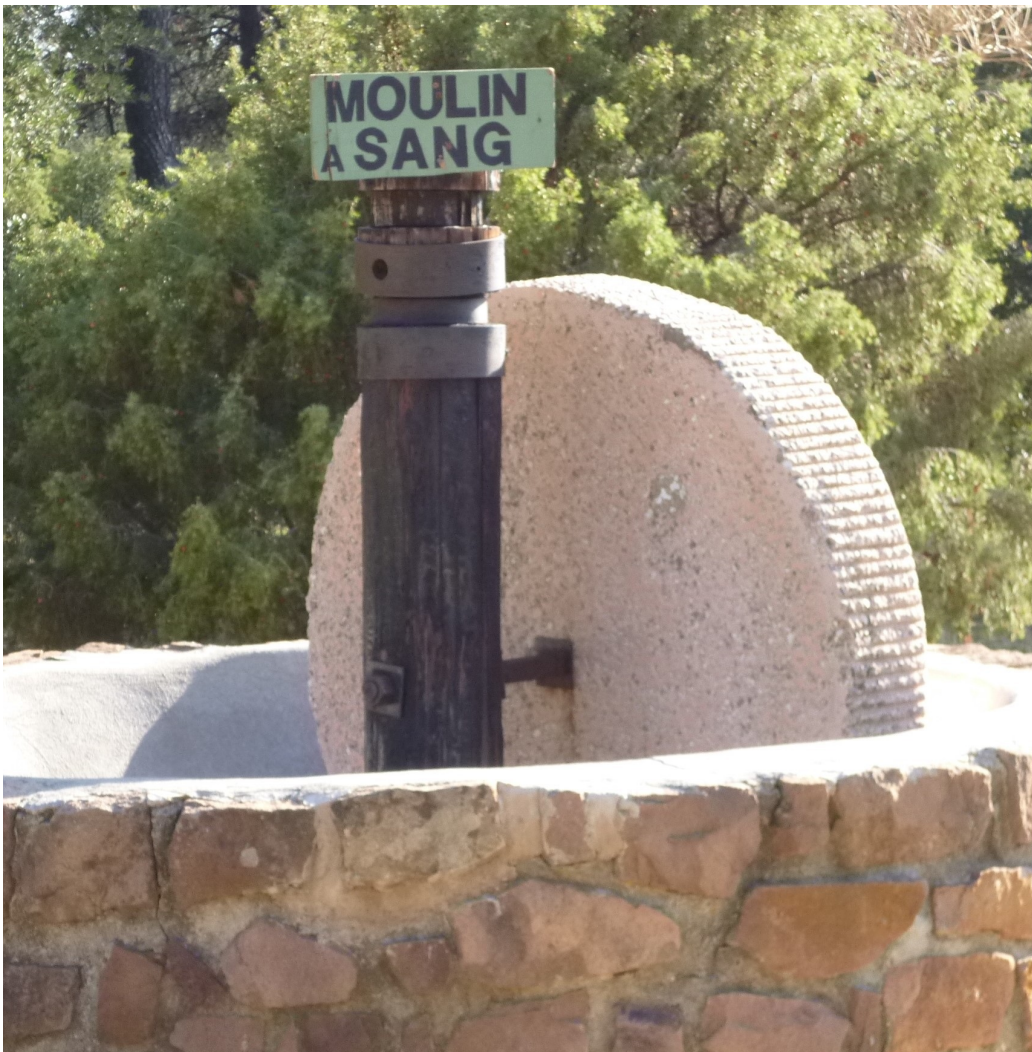
Un moulin à sang pour écraser les olives ainsi baptisé car il fallait suer sang et eau pour arriver à vaincre son inertie.