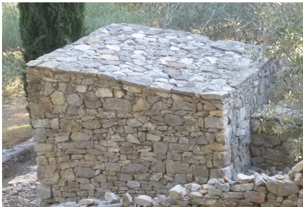
Cabanon reconstitué : un art consommé du travail de la pierre sèche.