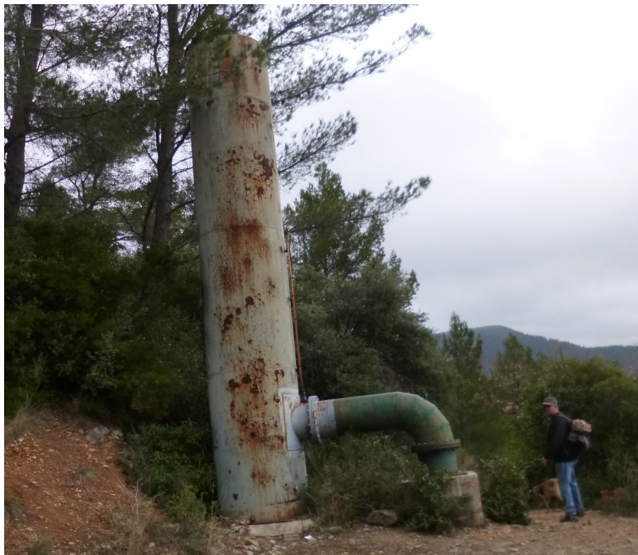
Un équipement en piteux état !