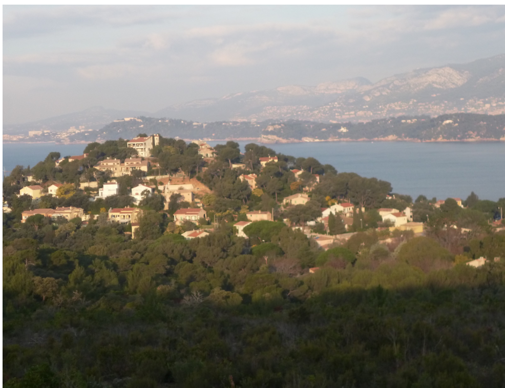
le village des Oursinières.

En revanche, comme toujours lorsqu'il s'agit de Toulon, le spectacle qui se déroulera à nos pieds sera de toute beauté. En voici quelques images :