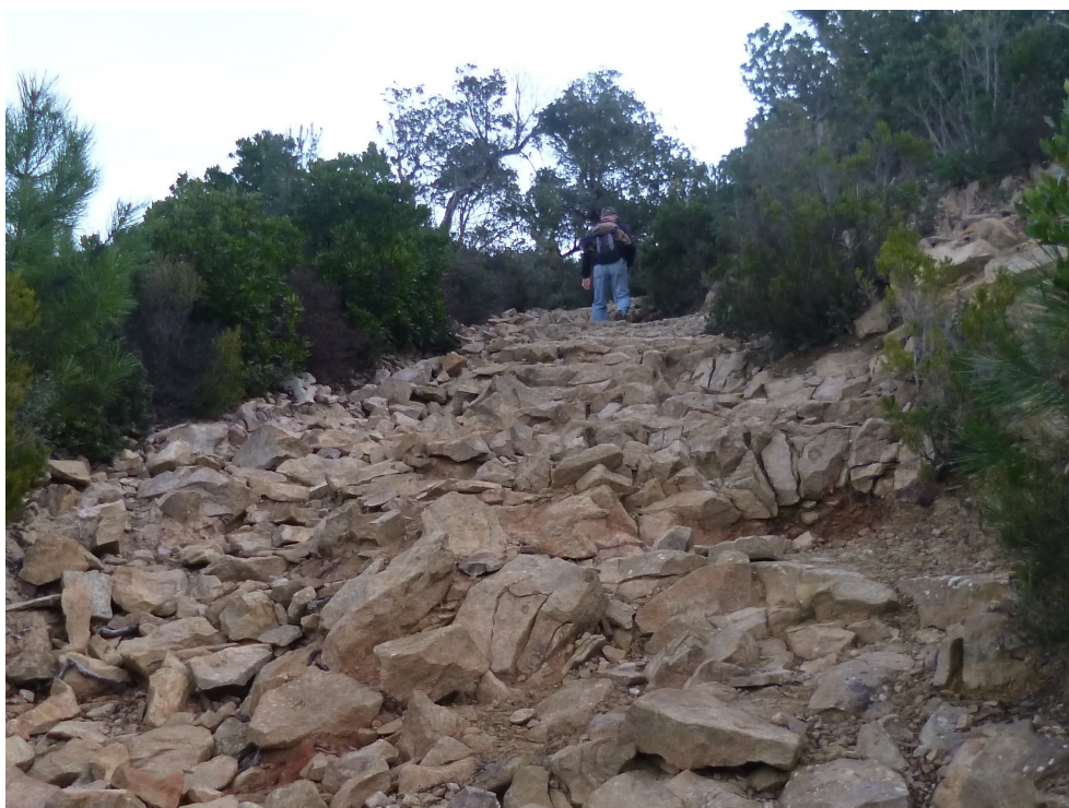
Ici, à la montée comme à la descente, les chevilles seront très sollicitées.

En revanche, comme toujours lorsqu'il s'agit de Toulon, le spectacle qui se déroulera à nos pieds sera de toute beauté. En voici quelques images :