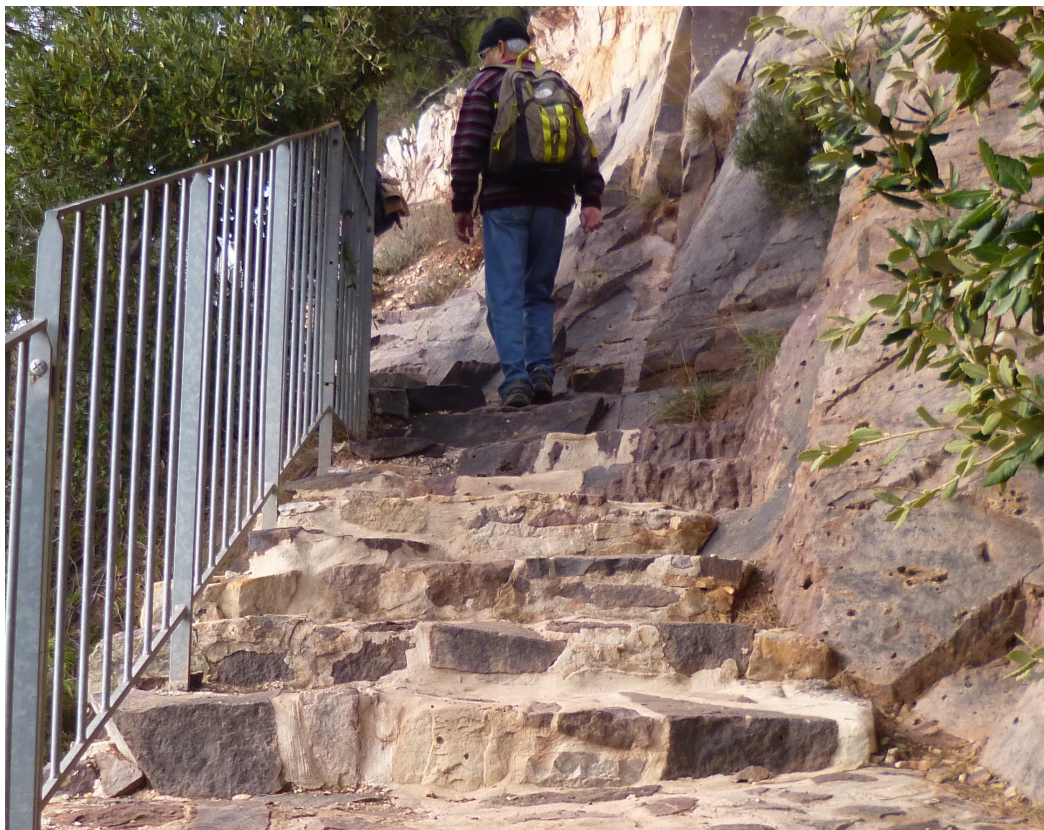
Quelque part sur Le pas des Gardéens.

Sur le chemin du retour, à hauteur de la mine de la Garonne, il est prévu de rejoindre l'emplacement du déjeuner par le sentier dit « le pas des Gardéens», lui aussi très escarpé.