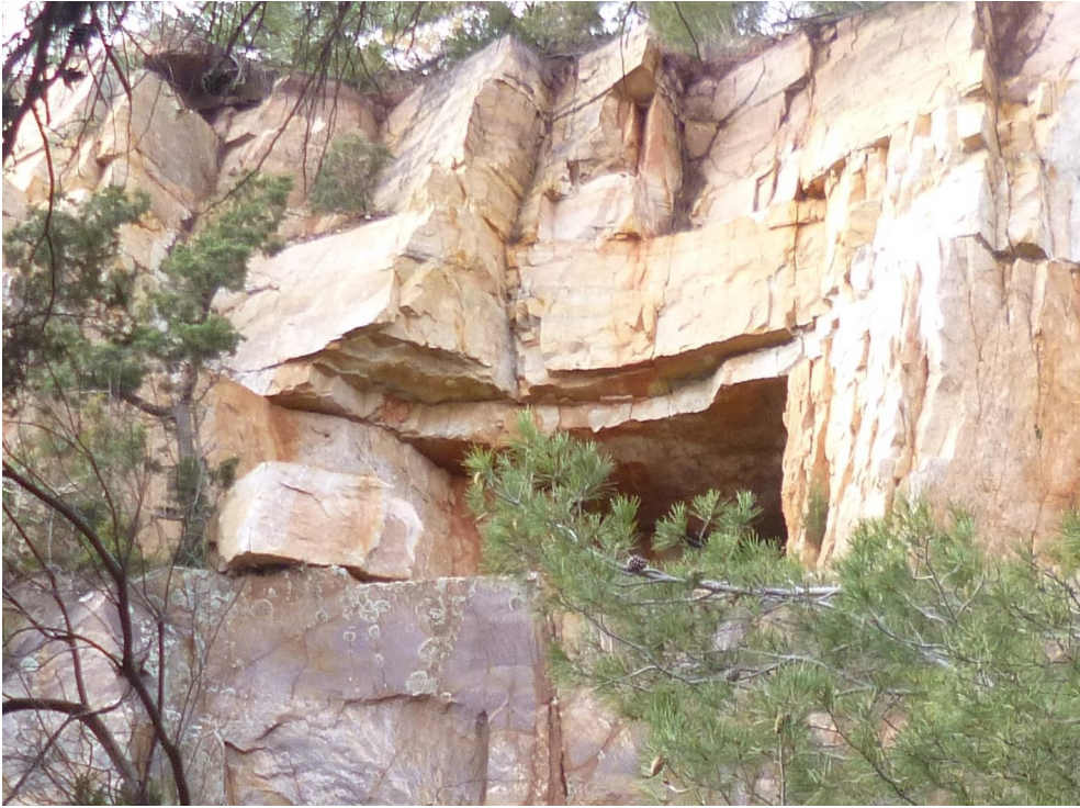
Navaronne sans les canons.

Certains pourront rentrer soit directement, soit le faire après avoir contourné la mine et d'autres en empruntant le Pas des Gardéens. Ces derniers n'oublieront pas de lever les yeux au passage pour voir ce qui ressemble assez étrangement à :