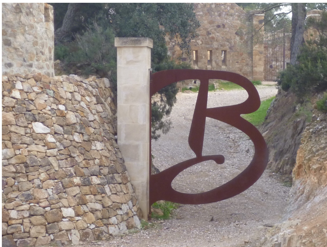
L'entrée et son portail.

Construit en 1896, à une altitude de 105m, il abritait une batterie de mortiers destinés à interdire le pilonnage de Toulon à partir de navires à l'ancre. Il a été aménagé pour accueillir diverses manifestations artistiques ou culturelles.