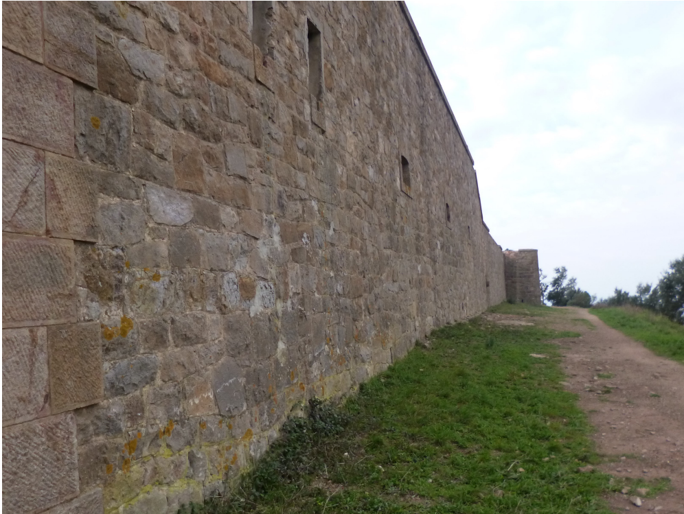
Le mur d'enceinte nord du Fort de la Gavaresse.