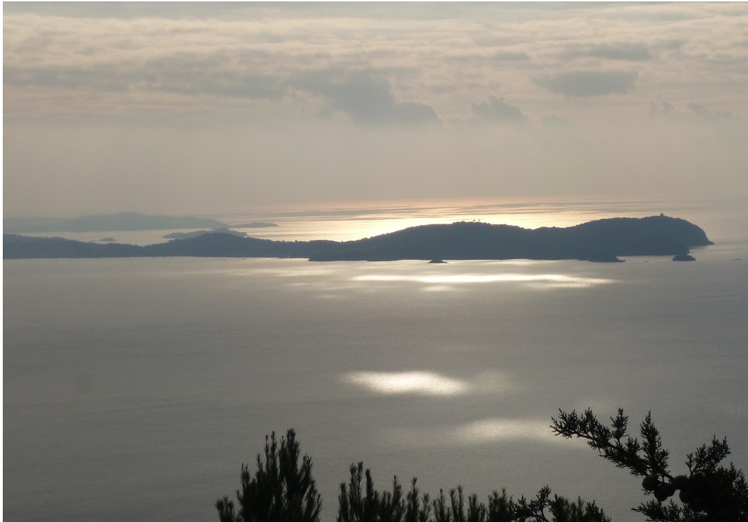
La presqu'île de Giens.

Sur le chemin du retour, à hauteur de la mine de la Garonne, il est prévu de rejoindre l'emplacement du déjeuner par le sentier dit « le pas des Gardéens», lui aussi très escarpé.