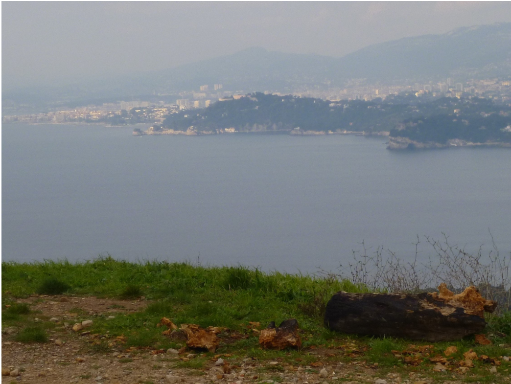
Sainte-marguerite, Magaud, Méjean et Le Mourillon.