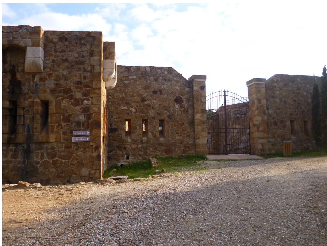
l'enceinte du Fort, en parfait état de conservation.