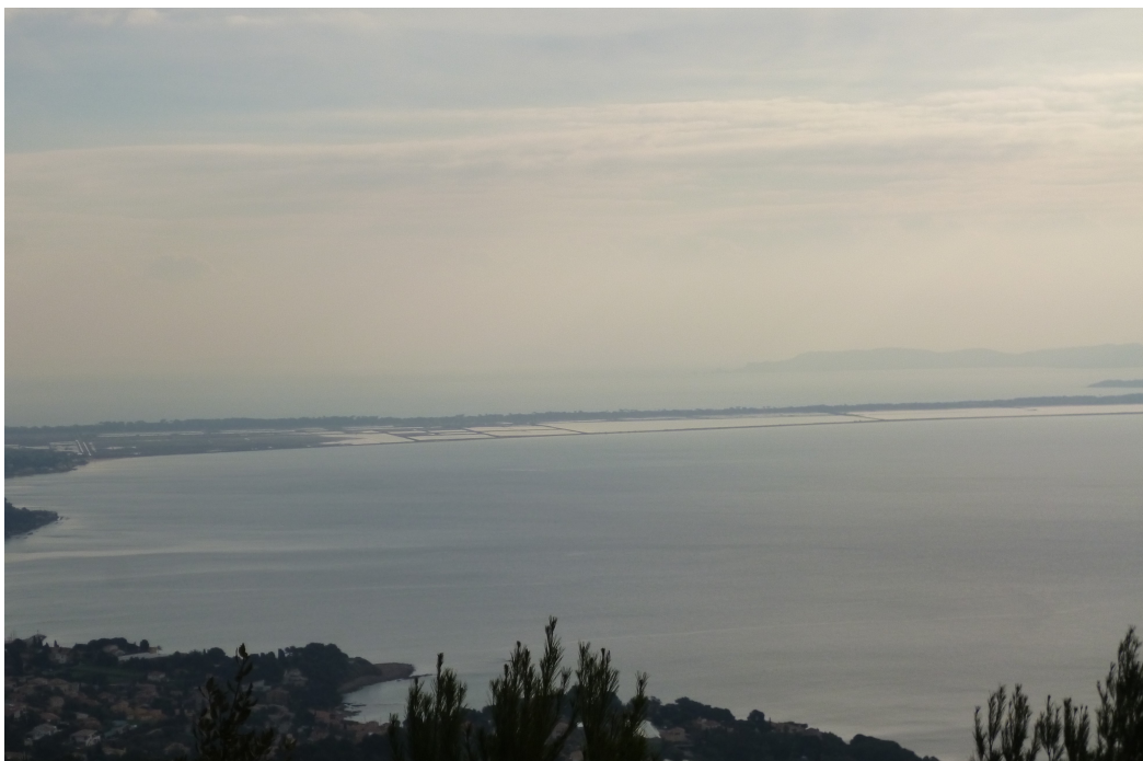
La route du sel.