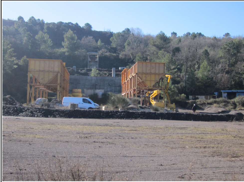
Carrière de sable et de granulats