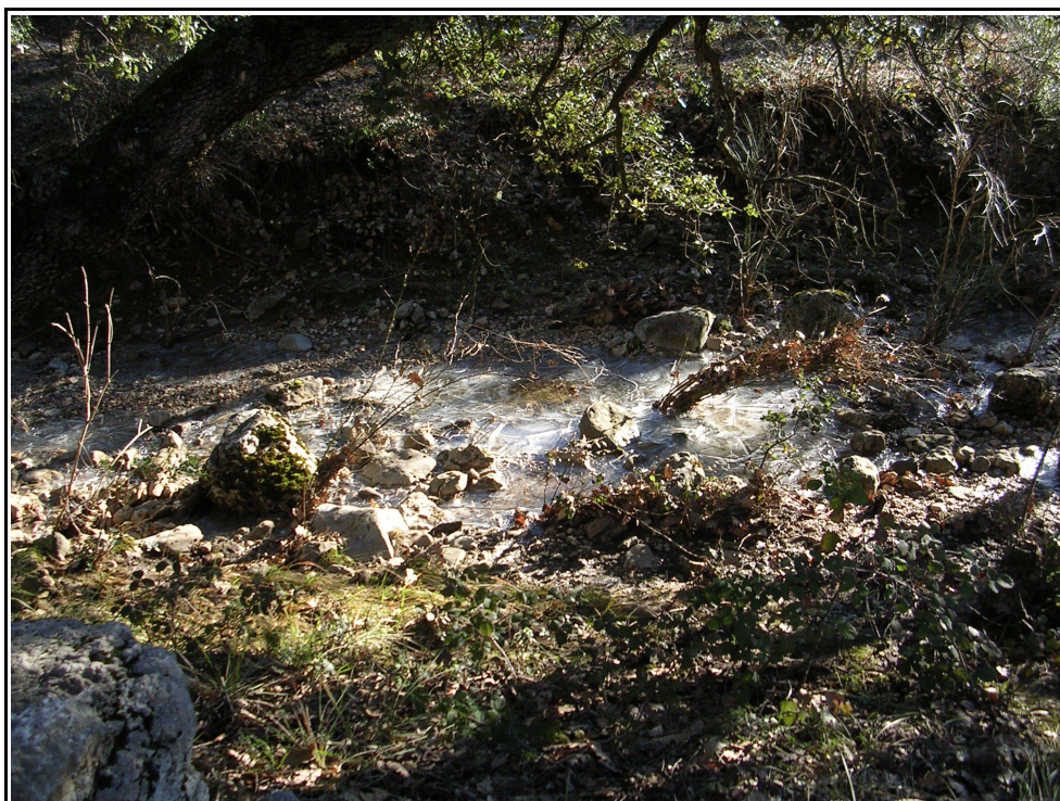
Le Destel sous la glace :