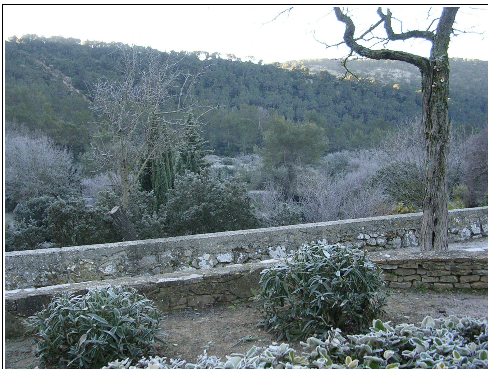
le Broussan sous le givre.

Il conviendra aussi de prendre en compte la température des lieux souvent très basse au Broussan comme en témoignent ces deux photos :