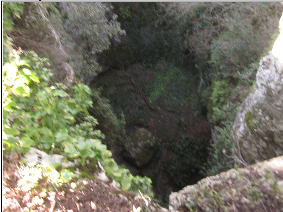
Le fond du gouffre