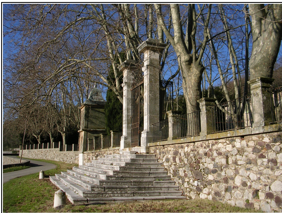
L'entrée du Château.