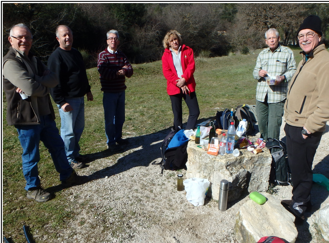
Le resto. de la reco..

Nous avons tardé à faire cette présentation car nous nous sommes heurtés, lors d'une première reconnaissance, aux limites d'une immense propriété qui nous a barré le passage et obligé à chercher un itinéraire de contournement mais sans résultats. Toutefois le moral de l'équipe n'en a pas souffert, la preuve !