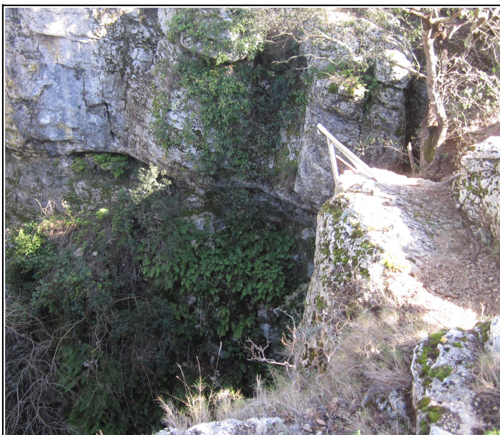
Les abords du gouffre