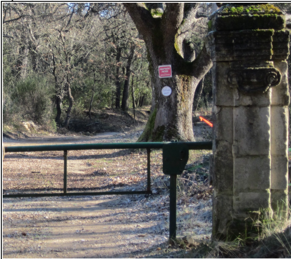
Portail de la bastide D'Orves