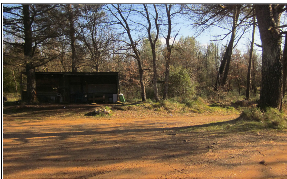
Le restaurant des Trotte-menus.