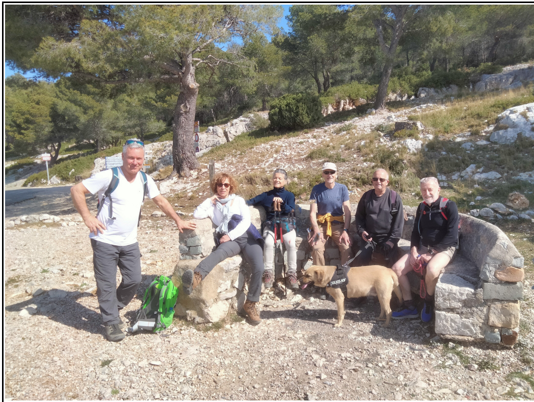
Équipe de reco

Le départ s'effectue à proximité de la station d'épuration, sur le parking du site d'observation astronomique de la ville et d'un grand parcours sportif. Garer sa voiture sur le premier parking en terre à gauche de la route (on entre entre 2 grosses pierres ; sur la pierre de droite il y a un trait bleu).