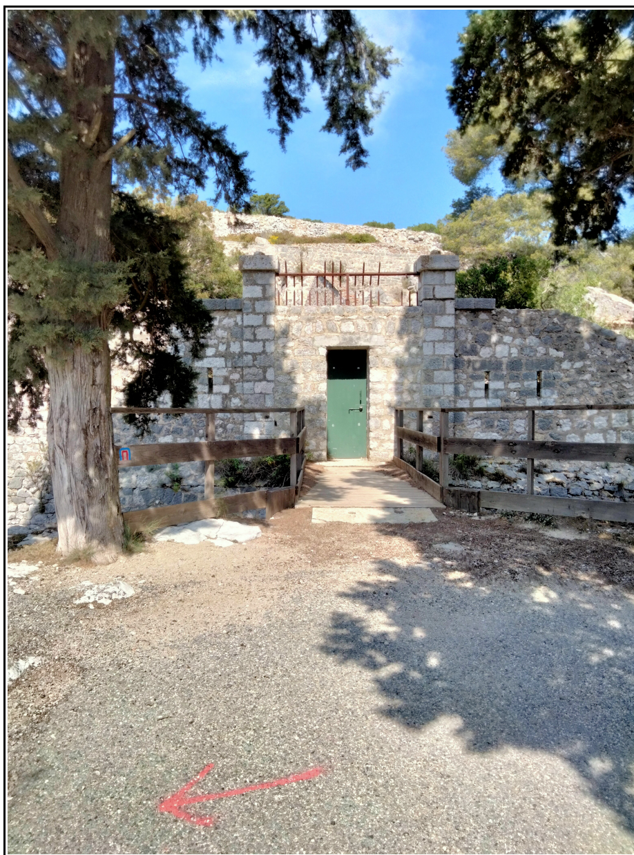
Entrée du Fort

L'ouvrage du Gros Cerveau recevait une garnison de 250 hommes du 2ème bataillon du 115ème régiment territorial d'infanterie et 260 hommes de la 7ème batterie et de la 13ème batterie à pied d'artillerie. Les deux casernements de l'ouvrage de la Pointe étaient capables d'héberger chacun un officier et 108 hommes.