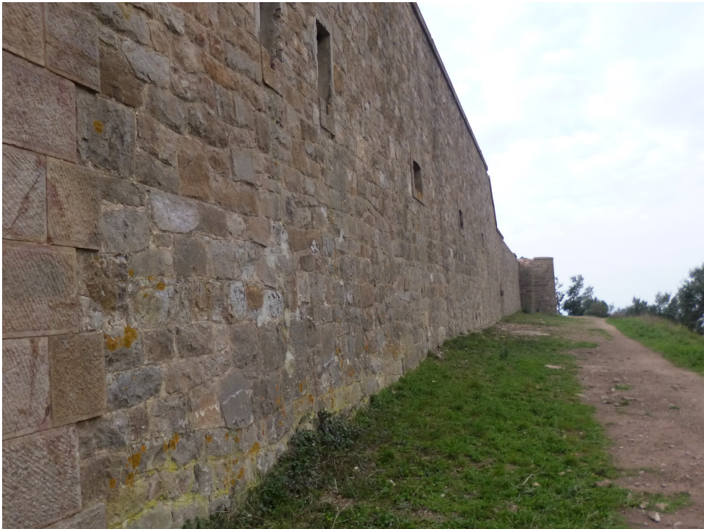
Le mur d'enceinte nord du Fort de la Gavaresse.