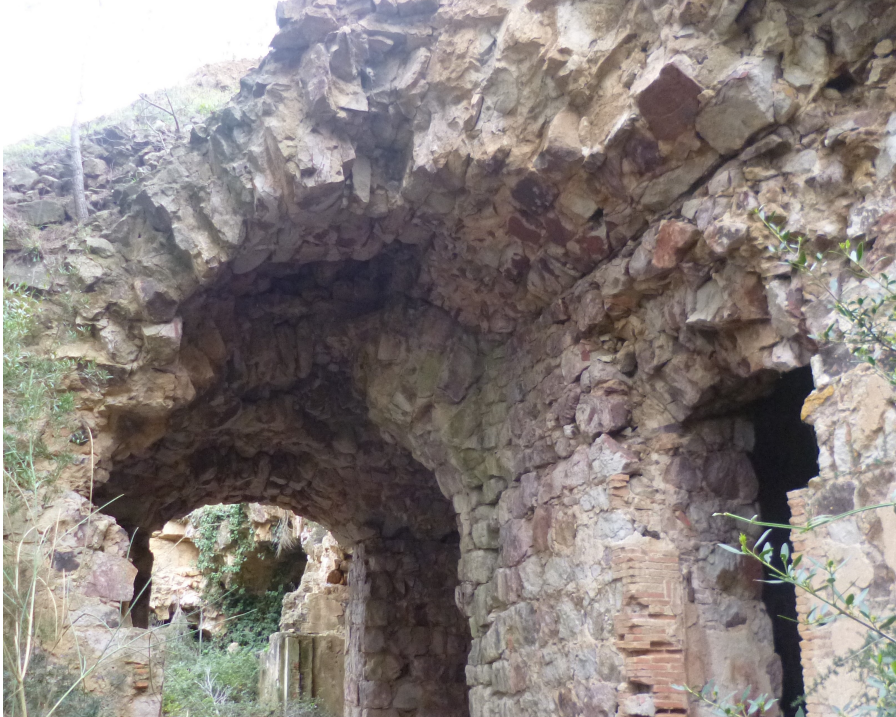
Attention : il serait dangereux de s'aventurer plus loin.

Construit entre 1878 et 1880 au sommet de la colline à 295m, il complétait, avec le Fort du Coudon , une barrière de protection de l'est de Toulon. Des douves, encore visibles par endroits, ceinturaient la totalité de son périmètre. Un dépôt de munition explosa en août 1946 et un autre en août 1949. Très puissante, la deuxième explosion entraîna la destruction d'une bonne partie de l'ouvrage et effectivement, il n'en reste pas grand chose comme le montre la photo suivante.