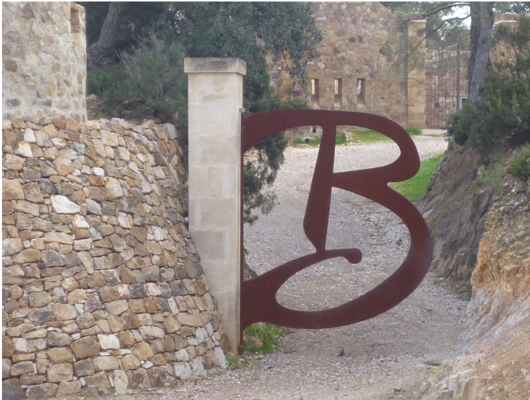
L'entrée et son portail.

Construit en 1896, à une altitude de 105m, il abritait une batterie de mortiers destinés à interdire le pilonnage de Toulon à partir de navires à l'ancre. Il a été aménagé pour accueillir diverses manifestations artistiques ou culturelles.