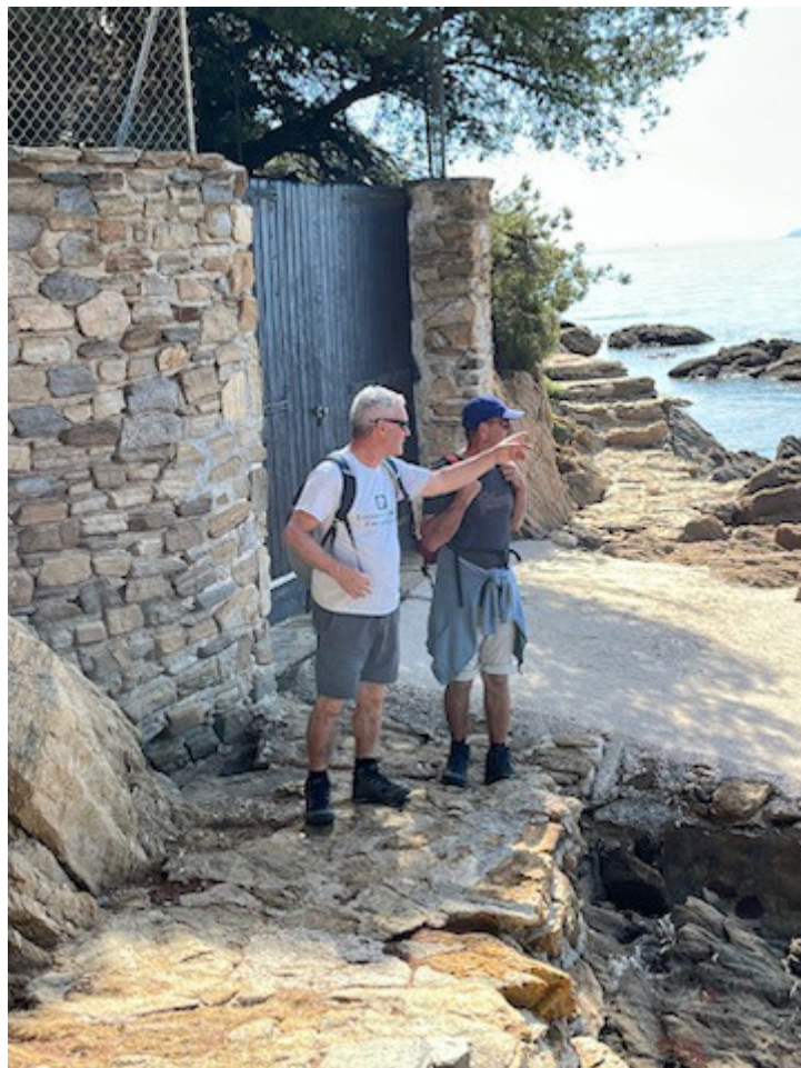
On souffre dans les montées

Caché au fond du Trou, il faut monter jusqu'au photographe